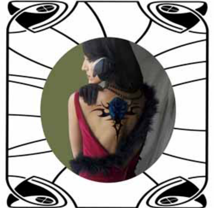
“Sin título” De la serie “Memorias del futuro” 52 x 52,8. Impresión lambda en papel brillante. 2009