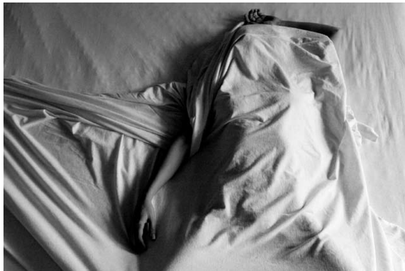
“Sin título” de la serie “Sueños” 60 x 40cm. Toma Directa Archival print. Impresa en Innova Soft Textured Natural White, 315gsm. Impresora Epson Stylus Pro 9880 con sistema de tintas Epson UltrachromeK3 y aplicación de Fine-Arts Barnish. 2009