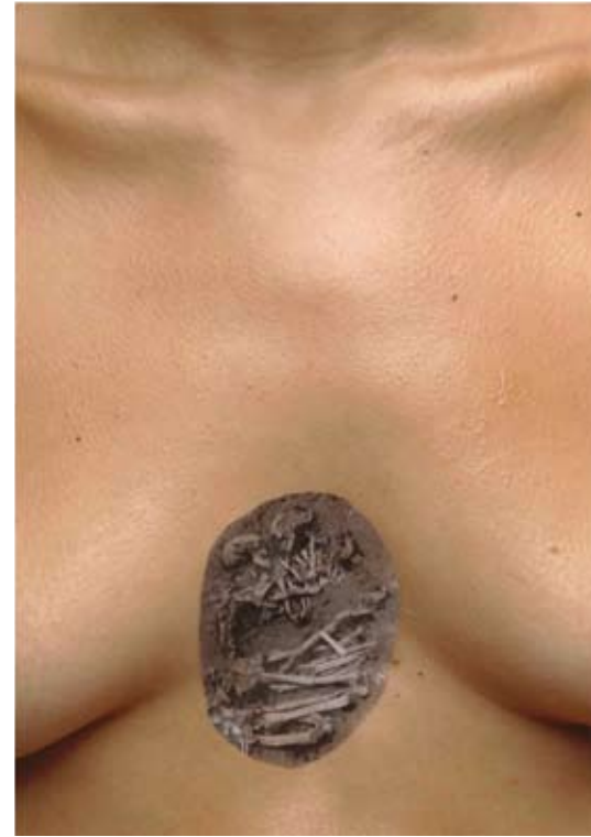
"Escapulario" 90 x 60cm. Toma directa, performing fotográfico. 2008