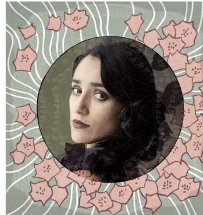
“Sin título”. De la serie “Memorias del futuro” 52 x 52. Impresión lambda en papel brillante. 2009