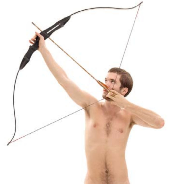
"Zen en el Arte del Tiro con Arco" (Cupido) 50 x 40 cm. Toma Directa, foto-performance. 2009.