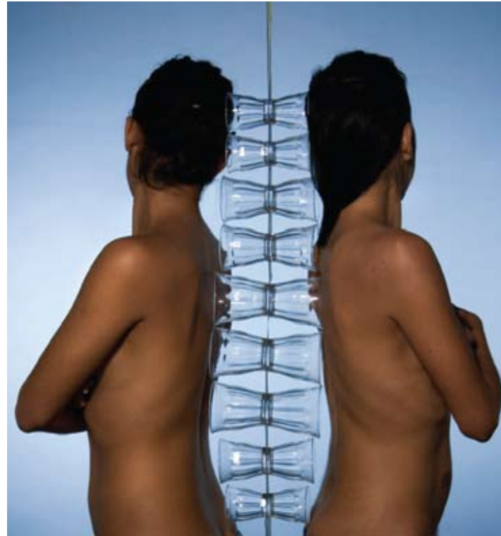
"Vasos Comunicantes" 120 x 100 cm. Toma directa, performing fotográfico. 2008