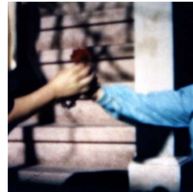
“Sin título” De la serie “Fábulas” 42 x 42cm. Impresión a chorro de tinta sobre papel de algodón 2007