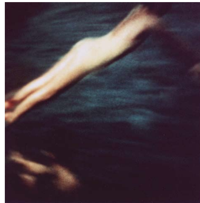
“Sin título” De la serie “Fábulas” 100 x 100cm. Impresión a chorro de tinta sobre papel de algodón. 2007