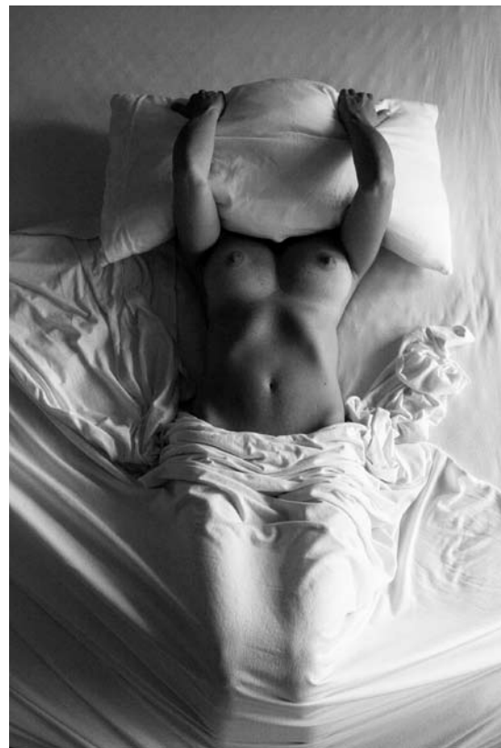
“Sin título” de la serie “Sueños” 60 x 40cm. Toma Directa Archival print. Impresa en Innova Soft Textured Natural White, 315gsm. Impresora Epson Stylus Pro 9880 con sistema de tintas Epson UltrachromeK3 y aplicación de Fine-Arts Barnish. 2009