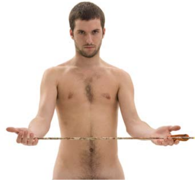
"Zen en el Arte del Tiro con Arco" (Entrega) 100 x 70 cm. Toma directa, foto-performance. 2009.