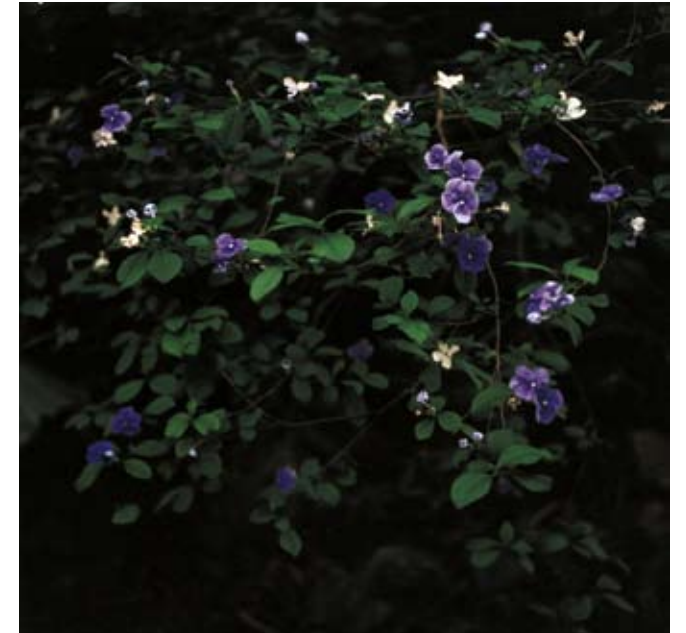
"Sin título" De la serie "Pequeño sistema de sabiduría". 60 x 60cm. Toma directa, impresión digital. 2006-2008