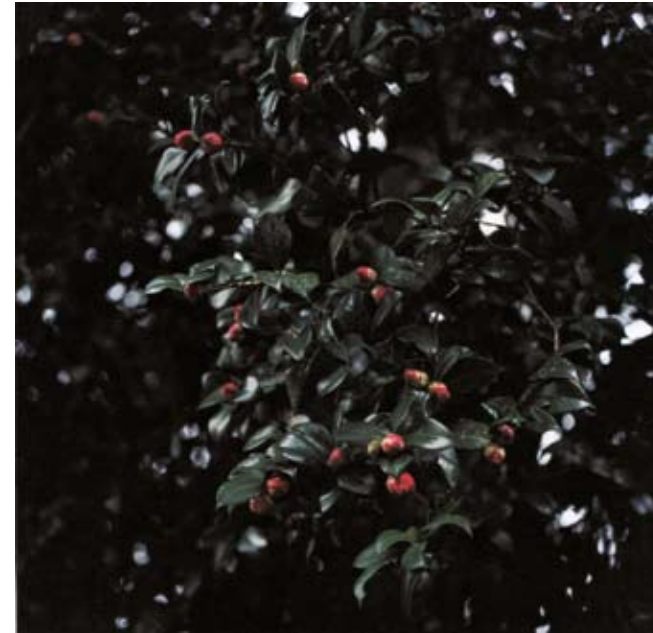
"Sin título" De la serie "Pequeño sistema de sabiduría". 60 x 60cm. Toma directa, impresión digital. 2006-2008