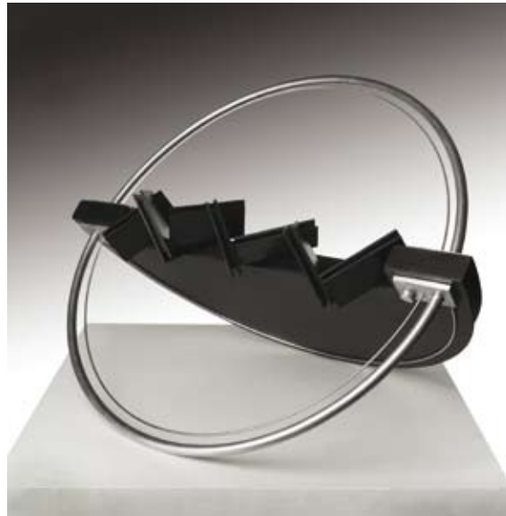
“En Juego I.” Acero Inoxidable y PVC. 40 x 40 x 40 cm. 2007