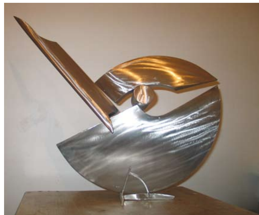
"0124 Serie del corte 90" Acero Inoxidable. 0,90 x 0,21 x 0,75 Mts. 2005