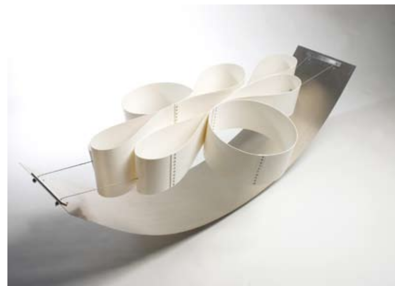
“ Movimiento sostenido” Acero inoxidable y PVC. 150 x 70 x 70 cm. 2009