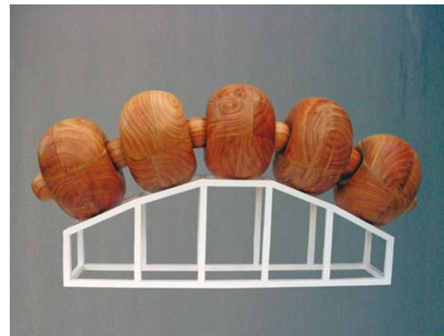
"Orgánico IV." Madera. 180 x 60 cm. 2008