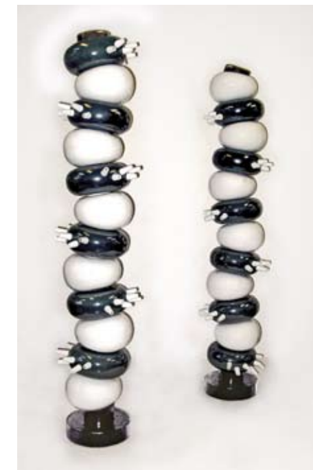
"Testigos 2009" Cerámica. 200 x 60 cu. 2009