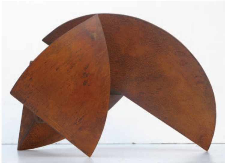
"Serie de la Ribera" Hierro patinado. 60 x 70 x 55 cm. 2007