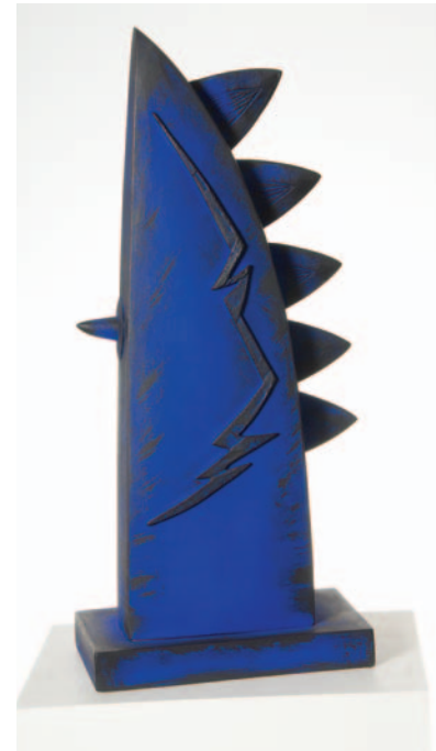
"El día de los rayos" Madera y hierro. 61 x 29 x 12 cm. 2007