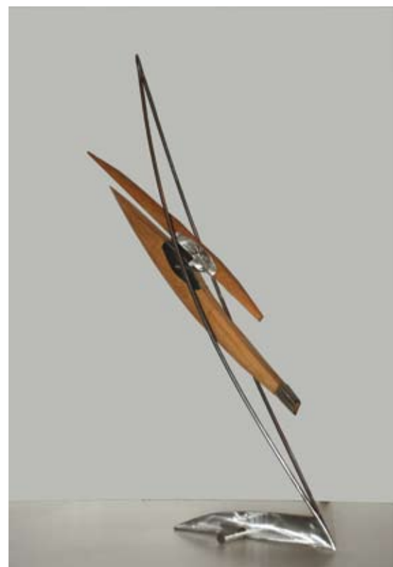
"0146 Red Acero" Acero Inoxidable y Cerejeira. 0,36 x 0,12 x 0,95 Mts. 2008