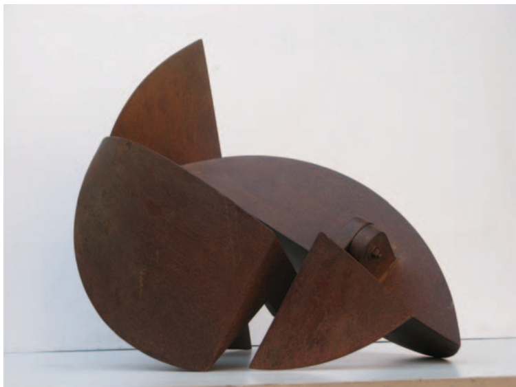
"Serie de la Ribera" Hierro patinado. 60 x 30 x 30 cm. 2009