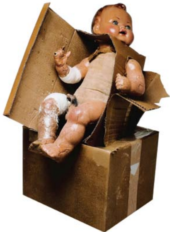
Bebe cartonero Cartón, ensamblaje / 38 x 48 x 40 cm / 2006