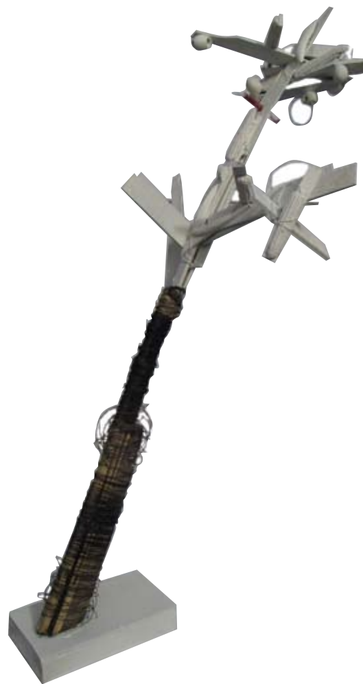
Primero el huevo Instalación