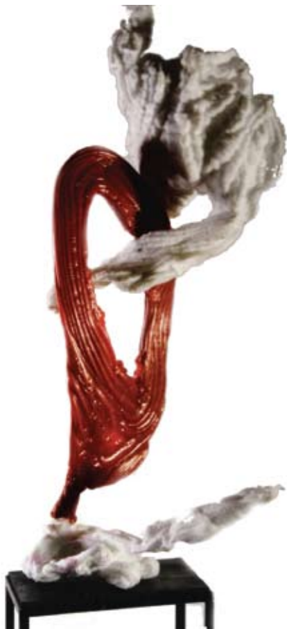
El Intento Plástico reciclado / 30 x 40 x 60 cm / 2007