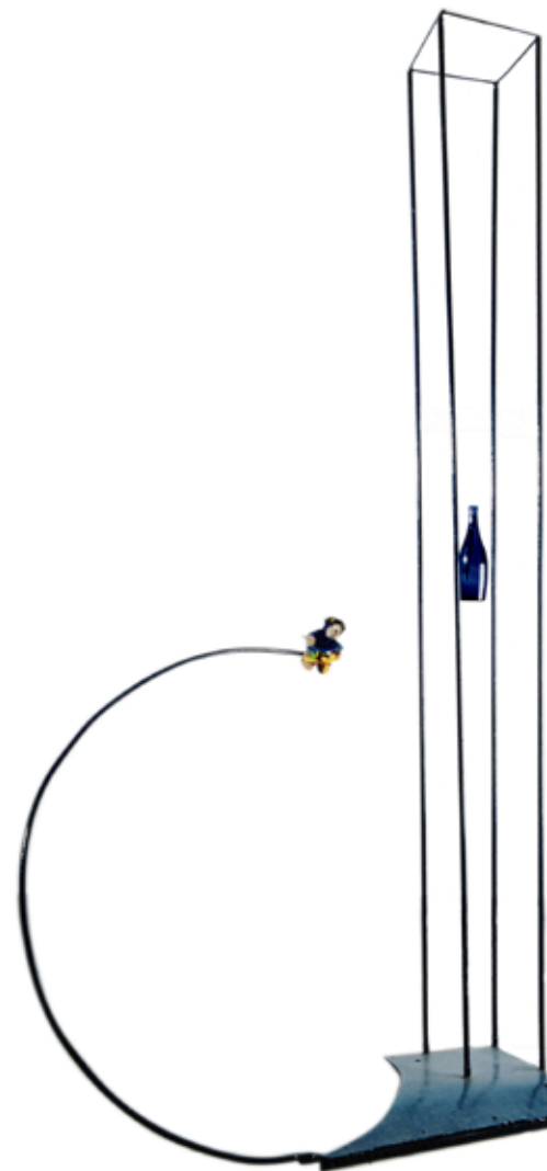
Volare Hierro, juguete, botella / 200 x 150 x 10 cm / 2004